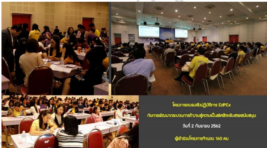
โครงการอบรมเชิงปฏิบัติการ EdPEx กับการพัฒนากระบวนการทำงานสู่ความเป็นเลิศสำหรับสายสนับสนุน วันที่ 2 กันยายน 2562 ผู้เข้าร่วมโครงการจำนวน 160 คน