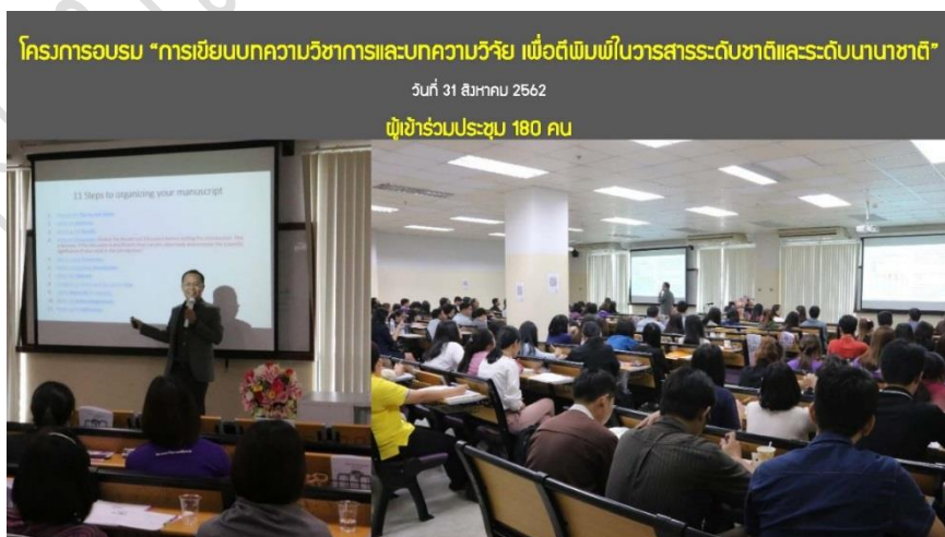
โครงการอบรม “การเขียนบทความวิชาการและบทความวิจัย เพื่อตีพิมพ์ในวารสารระดับชาติและระดับนานาชาติ” วันที่ 31 สิงหาคม 2562 ผู้เข้าร่วมประชุม 180 คน