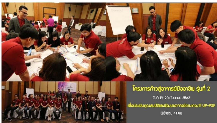
โครงการก้าวสู่อาจารย์มืออาชีพ รุ่นที่ 2 วันที่ 19-20 กันยายน 2562 เพื่อประเมินคุณสมบัติและพัฒนาศาจารย์ตามเกณฑ์ UP-PSF ผู้เข้าร่วม 41 คน