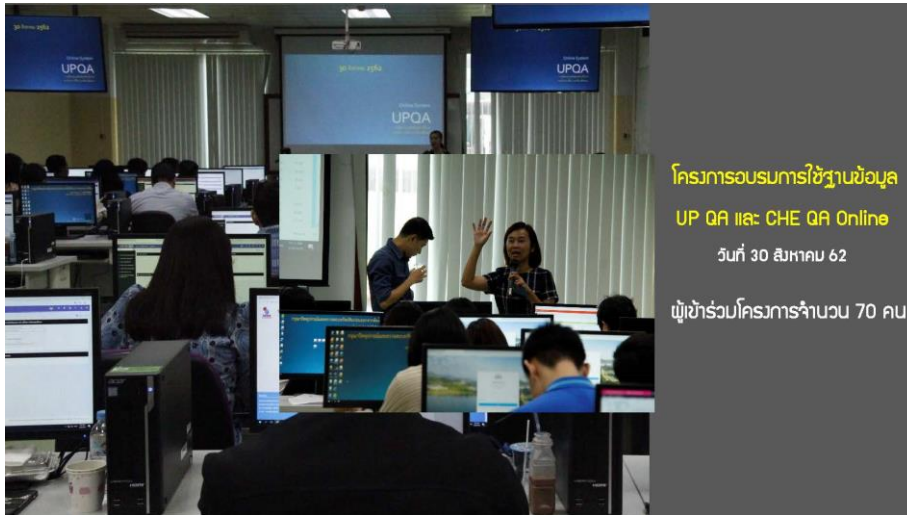
โครงการอบรมการใช้ฐานข้อมูล UP QA และ CHE QA Online วันที่ 30 สิงหาคม 62 ผู้เข้าร่วมโครงการจำนวน 70 คน