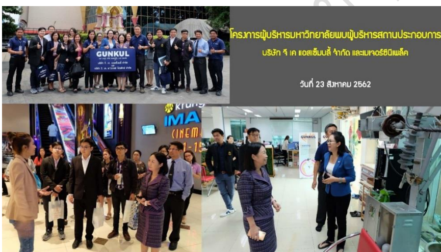
โครงการผู้บริหารมหาวิทยาลัยพบผู้บริหารสถานประกอบการ บริษัท ๙ เคา แอสซิเมบลี จำกัด และมาจอร์ฮิตเพล็กซ์ วันที่ 23 สิงหาคม 2562