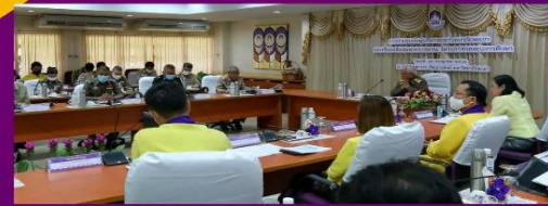
มหาวิทยาลัยพะเยา UNIVERSITY OF PHAYATHAI