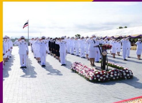
มหาวิทยาลัยพะเยา UNIVERSITY OF PHAYATHAI