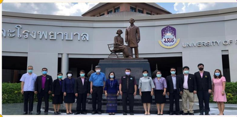
มหาวิทยาลัยพะเยา UNIVERSITY OF PHAYAO