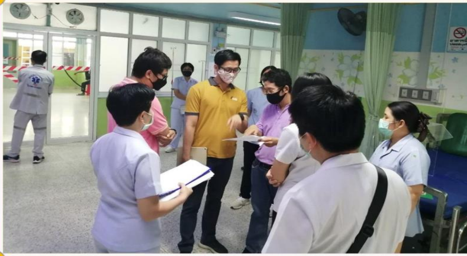
วิศวะ มพ. ส่งมอบห้องแยกการติดเชื้อ ทางอากาศความดันลบให้โรงพยาบาลพะเยา วันที่ 3 เมษายน 2563